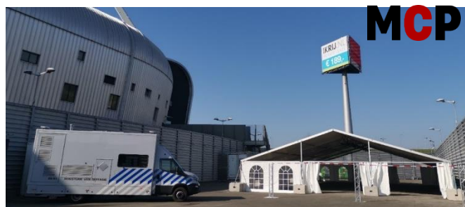
Opbouw van de Mobiele COVID-19 Post (MCP)

In de MCP blijven patiënten in de auto zitten. Er wordt een neusuitstrijk afgenomen en eventueel ook bloed. De MCP is iedere dag geopend van 8.00 uur tot 22.00 uur. De testen worden in een microbiologisch laboratorium uitgevoerd. De huisarts ontvangt binnen 24 tot 48 uur de uitslag. Op termijn kan in de MCP ook snelle diagnostiek uitgevoerd worden waardoor de uitslag bij spoed binnen een uur bekend kan zijn.